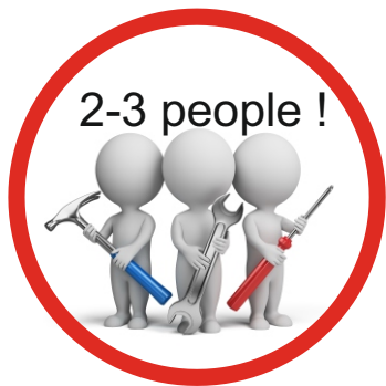
Figure The Flash:

Packaging: 3 cartons, total weight 61,6 kg Karton A: 90 x 48 x 36 cm - 11 kg Karton B: 124 x 52 x 43 cm - 22,6 kg Karton C: 114 x 63 x 38 cm - 28 kg 1 pallet 120 x 80 x 160 cm